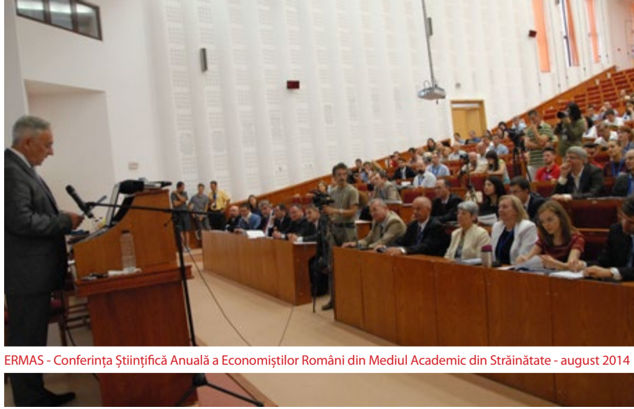
ERMAS - Conferința Științifică Anuală a Economistilor Români din Mediul Academic din Străinătate - august 2014

Consul al Ambasadei SUA la București. Discuțiile au vizat următoarele aspecte: Non-Immigrant Visas, Renewing an Existing Visa, Summer Work and Travel Program, The Interview Process, Immigrant Visas, Diversity Visa Lottery (14 noiembrie 2014)