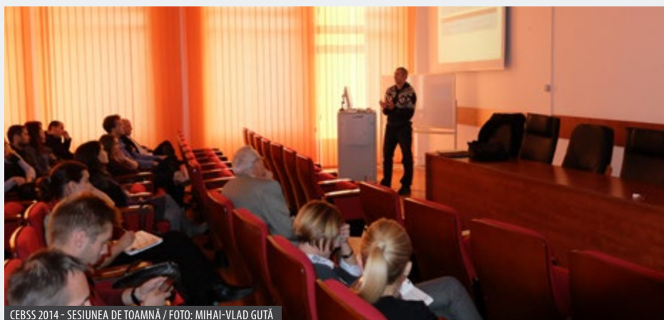
CEBSS 2014 - SESIUNEA DE TOAMNĂ

Abstract: Increasingly the next scientific discoveries and the next industrial innovative breakthroughs will depend on the capacity to extract knowledge and sense from gigantic amount of information. Examples vary from processing data provided by scientific instruments such as the CERN's LHC; collecting data from large-scale sensor networks; grabbing, indexing and nearly instantaneously mining and searching the Web; building and traversing the billion-edges social network graphs; anticipating market and customer trends through multiple channels of information. Collecting information from various sources, recognizing patterns and distilling insights constitutes what is called the Big Data challenge. However, as the volume of data grows exponentially, the management of these data becomes more complex in proportion. A key challenge is to