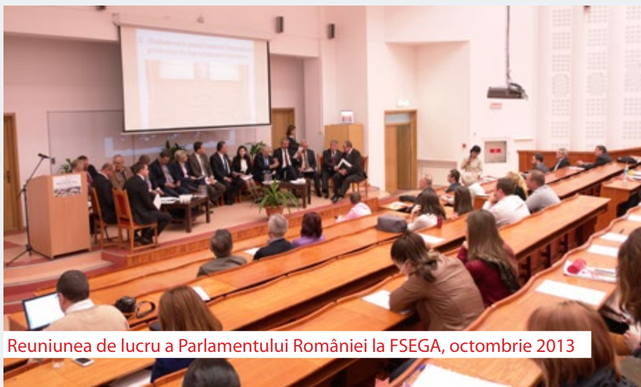
Reuniunea de lucru a Parlamentului României la FSEGA, octombrie 2013