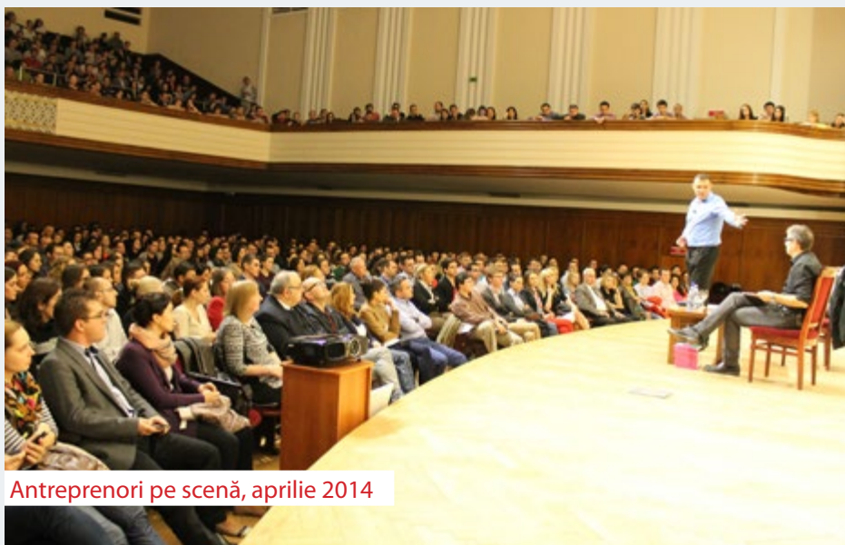
Antreprenori pe scenă, aprilie 2014

Dezbateră: Spiritul antreprenorial în rândul absolvenților clujeni cu participarea unor oameni de afaceri și reprezentanții unor prestigioase firme care operează pe piața Clujului, precum și a unor instituții și ONG-uri clujene (12 martie 2014);