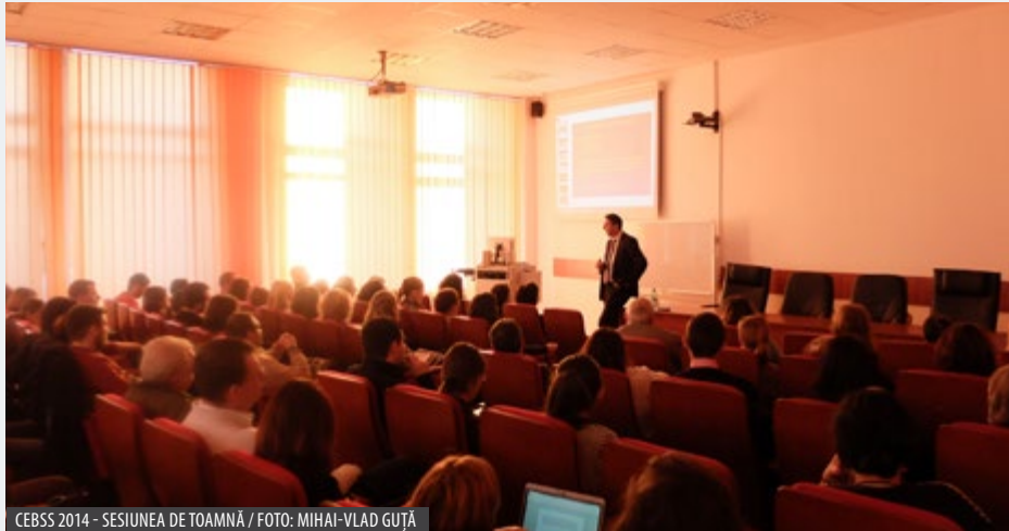
CEBSS 2014 - SEȘIUNEA DE TOAMNĂ

the past few years there have been a growing number of studies debating if cultural diversity and economic inequality have beneficial effects on social trust, or, on the contrary, detrimental ones. Some of these studies aimed to distinguish between effects of micro, mezzo and macro level attributes of the context on trust. However, one important topic that has received little empirical assessment is if the effects of a diverse context last longer than the exposure, a question that is particularly relevant in the case of migration, both internal and international. I investigated several causal assertions regarding the development of trust, using cross-national survey data, as well as data collected from Romanian high school and university students within a multilevel and longitudinal research design. My findings support the existence of a negative effect of the ethnic diversity at the micro-level context, but at the same time finds that to a large extent the effect is likely to be only temporary. They also show that income inequality has a negative and lasting effect on trust.