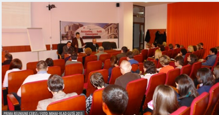
PRIMA REUNIUNE CEBSS / FOTO: MIHAI-VLAD GUȚĂ 2013